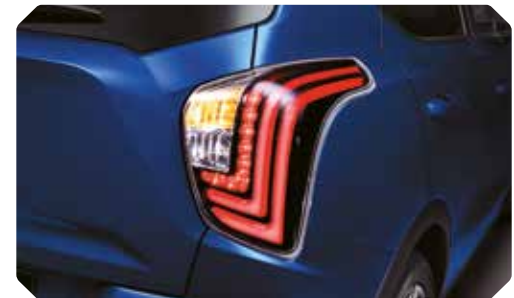
Feux arrière à LED