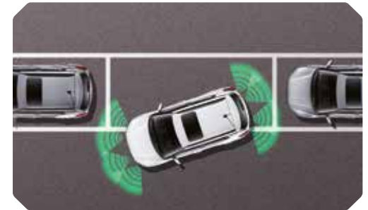
Aide au stationnement avant et arrière