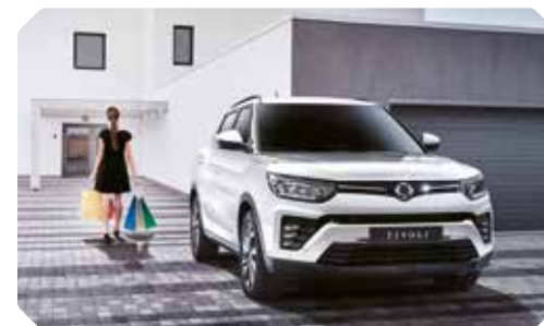
Verrouillage central automatique