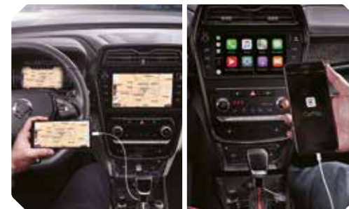
Google Android Auto et Apple CarPlay