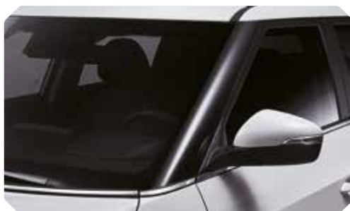
Garniture noir brillant sur les montants A