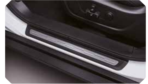
Seuils de porte avant en aluminium