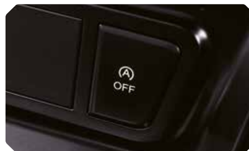
Désactivation possible du système stop-start