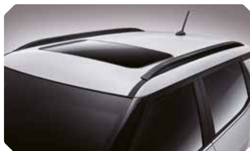
Rails de toit noirs élégants