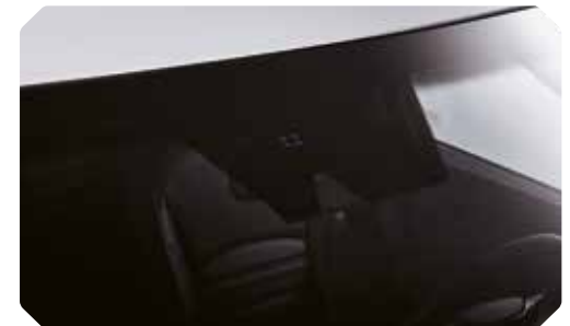
Détecteur de pluie