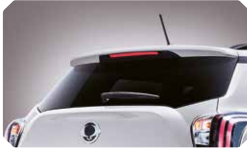
Aileron de toit sportif