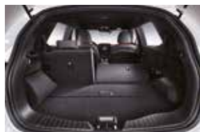
2ème rangée rabattue à 60 %