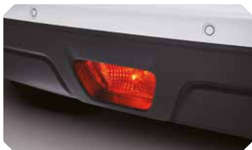
Feu arrière antibrouillard