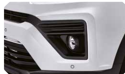
Phares antibrouillard de projection