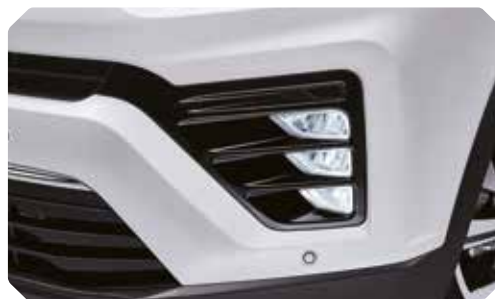
Phares antibrouillard à LED