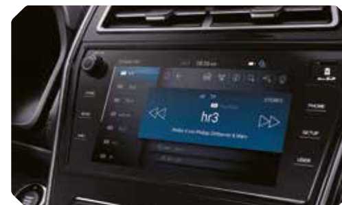
Écran tactile 9,2" avec navigation