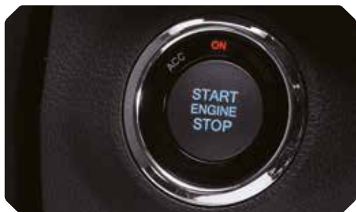
Bouton de démarrage