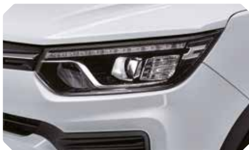
Phares de projection