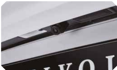
Caméra de recul