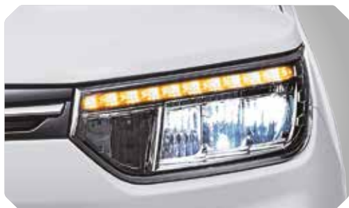
Phares à LED