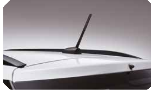
Antenne de toit