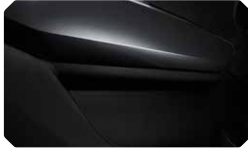
Panneau de porte