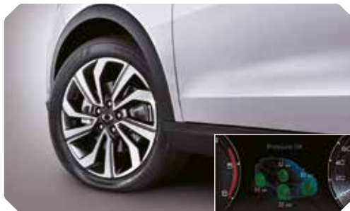
Contrôle de pression des pneus (TPMS)