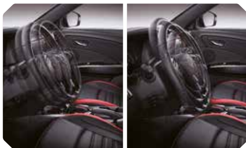
Volant réglable en profondeur et en hauteur