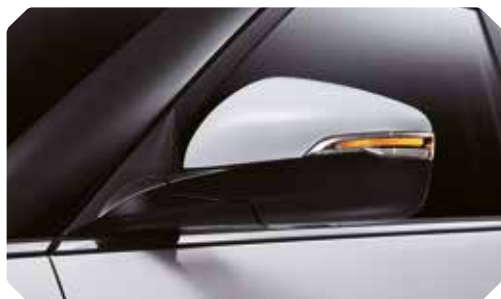
Clignotants LED sur les rétroviseurs extérieurs