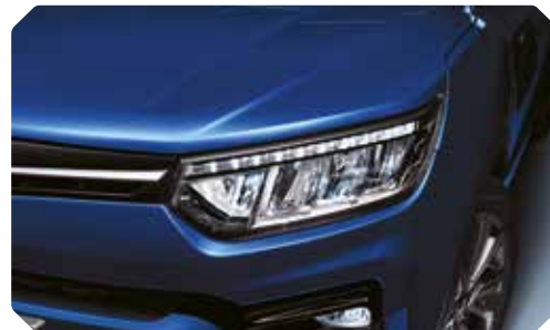
Feux avant à LED

Le Tivoli attire le regard à son profil reconnaissable. Les lignes très expressives sur les flancs renforcent son look puissant. Comme si le Tivoli était impatient de se mettre en route avec vous.