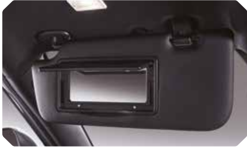
Miroir de courtoisie éclairé