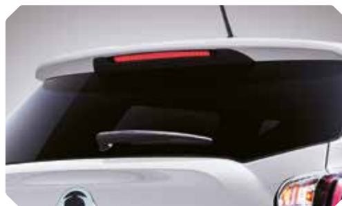
Feu de stop intégré dans l'aileron