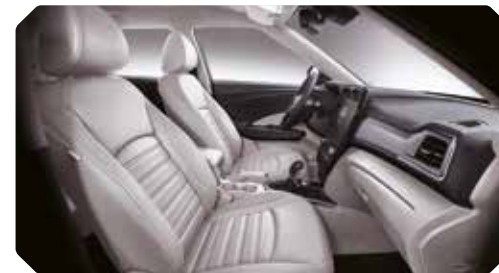
| Intérieur beige