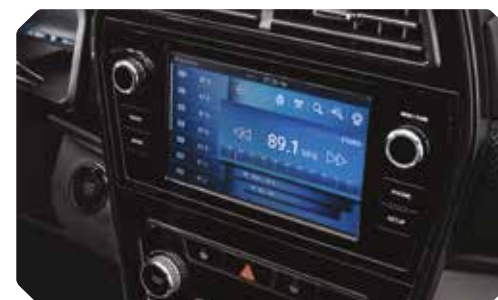
Écran tactile 8" avec radio