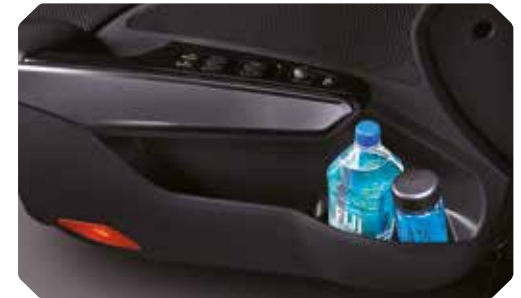
Grands compartiments pour cartes