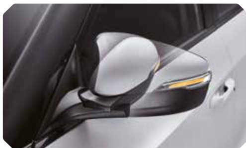
Rétroviseurs extérieurs à réglage électrique et rabattables