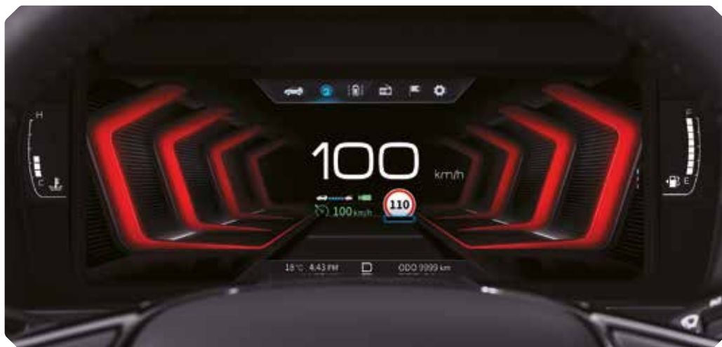
TABLEAU DE BORD 10,25" ENTièrement NUMÉRIQUE

L'habitacle du Tivoli est élégant et complètement dédié au conducteur. Vous pouvez opérer dans votre voiture à l'aveuglette, et les compteurs et témoins lumineux se lisent en un éclair. Entièrement connecté à votre smartphone, il permet de maximiser votre confort tout en réduisant les distractions.