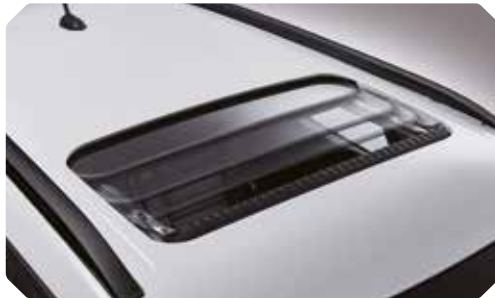
Toit ouvrant sécurisé